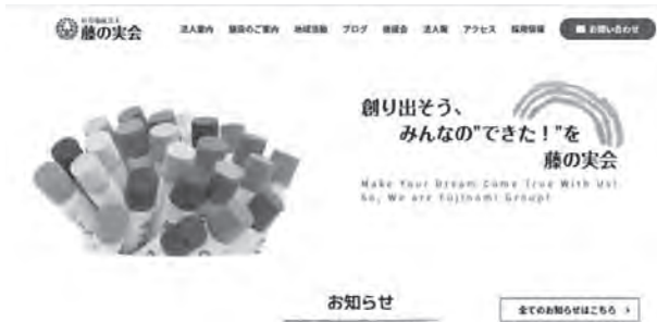
ホームページトップ画面

各施設のイベント報告や新商品の紹介、利用者の皆様の活動の様子など、当法人の事業所の雰囲気を感じていただける内容を随時更新しています。今後も地域に向けた情報発信を行っていきますので、皆様ぜひホームページをご覧ください。