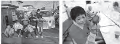
ブログ画面 ～随時更新！～