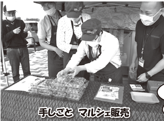
手しごと マルシェ販売