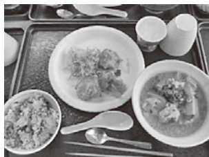
大分県の「あみ飯」「とい天」

そして2022年7月からは「全国ご当地麺の旅」を開始しました。第一回は、北海道中標津町の「中標津ミルクラーメン」です。スープに牛乳を使用したラーメンになります。これからも新しい発見があるといいですね。提供する私たちも楽しみにしています。