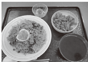
山口県「瓦そば」「チキンチキンごぼう」

調理部では2018年8月より北海道から沖縄県までを地図で辿りながら、全国の郷土料理を給食に取り入れてきました。2022年6月に沖縄県の郷土料理を提供して、日本一周完走しました。約4年間で初めて知る料理も多くあり、全国には地域で受け継がれた食べ物や風習がたくさんあるのだなと改めて感じました。中にはみなさんの口に合わなかった料理もあったようですが概ね、みなさんに喜んでいただけたのではないのでしょうか。