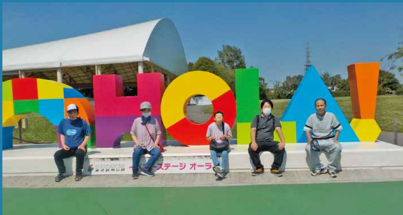
東武動物公園へ日帰り外出（ところざわ学園）

発行・編集人：社会福祉法人 藤の実会 編集人 社会福祉法人 藤の実会 発行日：令和4年8月1日 〒359-0004 埼玉県所沢市北原町932-1 TEL.04-2992-5096 FAX.04-2992-5095