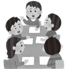
グループワークシート