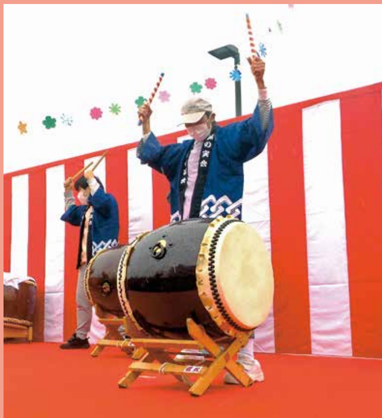
令和5年度法人祭 太鼓演奏の様子

発行・編集人：社会福祉法人 藤の実会 編集人 社会福祉法人 藤の実会 発行日：令和6年1月1日 〒359-0004 埼玉県所沢市北原町932-1 TEL.04-2992-5096 FAX.04-2992-5095