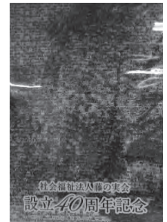
フォトモザイクアート